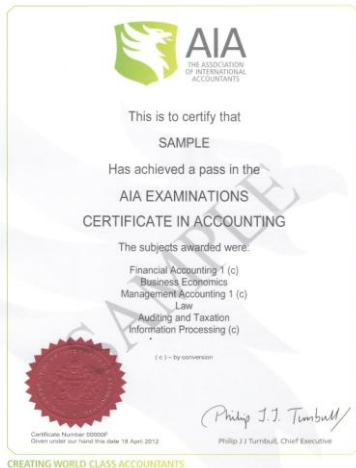
AIA 財會資格證書 Certificate in Accounting