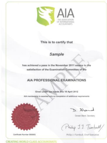
AIA 專業證書 Professional Examinations