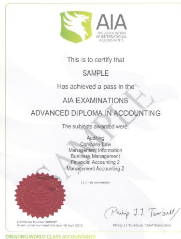
AIA 財會高級證書 Advanced Diploma in Accounting